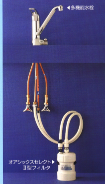
オアシックスセレクトⅡ型フィルタ *写真は配管イメージです。 なお、止水栓は製品に含まれません。

オアシックスセレクトは当社従来型浄水器と比べて約45%コンパクト化。設置スペースを気にせずお使いいただけます。また、付属のブラケットハンガーの使用により、壁面への固定ができます。